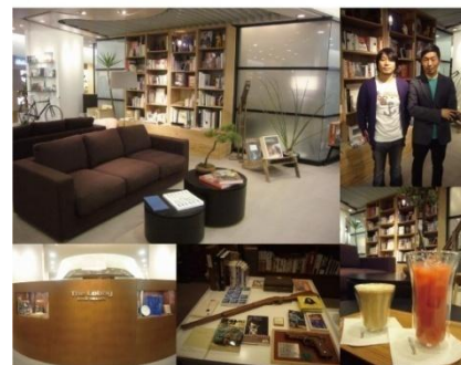
阪急メンズ館3F THE LOBBY

ソラディアパートナーショップ 50件からの配布 10000部～15000部 富裕層名簿へのDM直送2000部（詳細はお問い合わせください） 駅前配布 5000部（不定期）